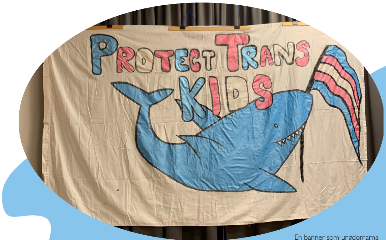
En banner som ungdomarna gjorde i samband med Trans Day of Remembrance.